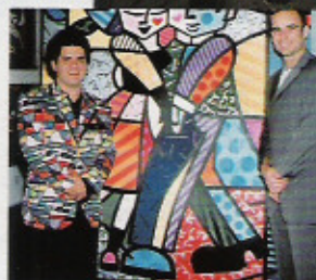
O ex-tenista André Agassi posa diante de um quadro de Romero, nos Estados Unidos