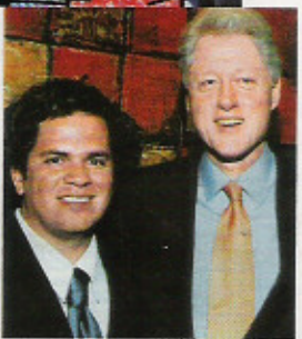
Com Bill Clinton, um dos compradores famosos de seus quadros