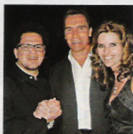
Com Arnold Schwarzenegger e a mulher dele, Maria: 18 quadros na casa do governador da Califórnia