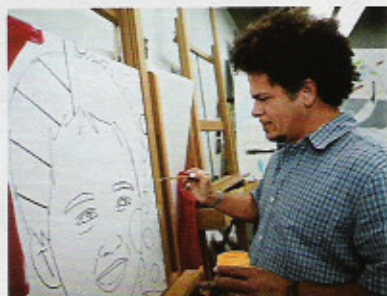
As cores na moto e pintando em seu estúdio: "Quero que minha arte seja democrática"

CLAUDIA Como vê seu futuro? ROMERO BRITTO Não penso muito nisso. No momento, estou feliz. Pinto, me emociono... Sou muito otimista. Acho que vou ter um futuro brilhante, mas, para tanto, tenho consciência de que preciso trabalhar bastante ainda. E quero que o mundo fique melhor, que as pessoas sofram menos. ◊