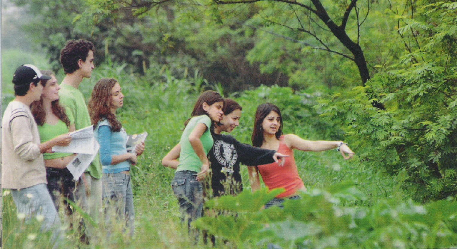
PIONEIRISMO Alunos do novo curso da Universidade de São Paulo na área de gestão ambiental

comum é que elas suprem necessidades específicas. "Promissoras não são apenas as atividades novas, mas ramos novos dentro de carreiras tradicionais", afirma o headhunter Guilherme Velloso, da consultoria PMC Amrop. É o caso do Direito. São tantos os estudantes que saem das faculdades todos os anos que o mercado para os advogados é considerado saturadíssimo. Mesmo assim há vagas para quem se especializa em Direito Empresarial e Internacional, por exemplo. Já na medicina e na biologia, quem se dedicar à genética também pode encontrar um nicho interessante.